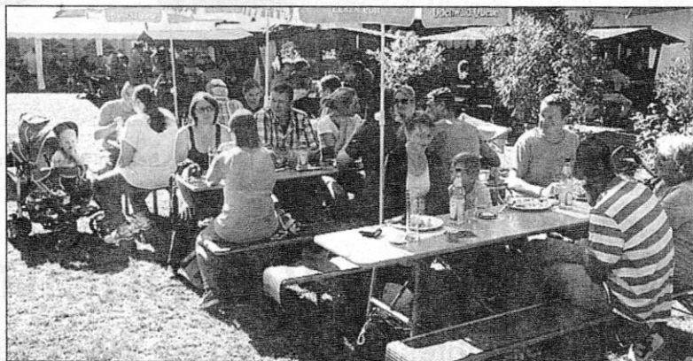
Nach zwei Stunden kurzweiligem Aufenthalt ging es wieder hinab zum Parkplatz und die Gruppe fuhr in Kolonne nach Heppenheim-Kirschhausen in die dortige Gaststätte zum „Steigkopf“.